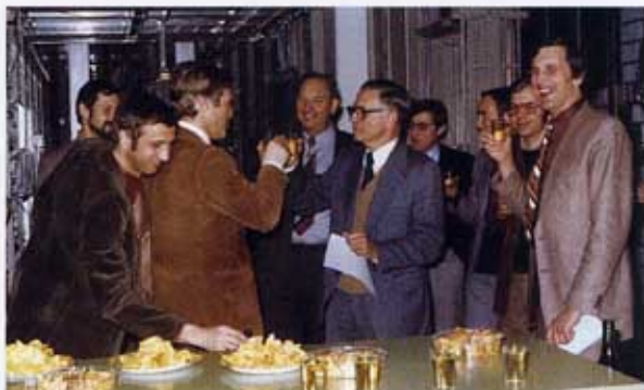
161. EINWEIHUNG DES IFS-MUSTERSTEUERBEREICHES, 1980.

Ungeachtet der genannten Schwierigkeiten und speziellen Anforderungen, liessen sich die Projektarbeiten zunehmend institutionell absichern. Für die helvetisch organisierte Arbeitsgemeinschaft folgte eine fruchtbare Konzeptarbeit, die in einer relativ kleinen, aber gut ausgestatteten und hochmotivierten Gruppe von Ingenieuren durchgeführt wurde. 1976 schaffte sie den eigentlichen Durchbruch: Es gelang ihr, eine digitalisierte Transitzentrale während dreier Monate im Echtverkehr zu betreiben. Der Leitende Projektausschuss erachtete damit das Ziel des