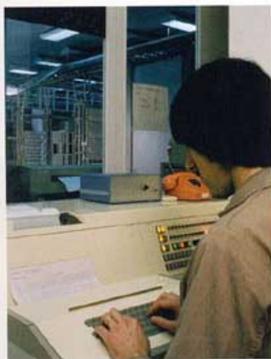
160. BETRIEBSKONTROLLE EINER IFS-VERSUCHS-ANLAGE.

Organisationsform der Forschungs- und Entwicklungsarbeiten. Sie scheint sich von einem wachstumsbedingten Unbehagen im Kleinstaat genährt zu haben und ist dennoch – organisatorisch gesehen – jener helvetischen Malaise verfallen, die Max Imboden schon 1964 diagnostiziert hatte. 8 Aufschlussreich ist diesbezüglich das Protokoll der ersten Besprechung der PTT mit Vertretern der Industrie vom 27. November 1967. Das Eröffnungsvotum des PTT-Vertreters enthielt die folgenden bedeutungsschweren Sätze: «Als Fernziel wird ein einheitliches schweizerisches PCM-Übertragungs- und Vermittlungssystem angestrebt. Die Unabhängigkeit vom Ausland sollte erhalten bleiben. Wir können uns keine Zersplitterung der Kräfte leisten und wünschen daher die Mitarbeit der Firmen.» 9 Damit kam im Grunde genommen genau jene «helvetische Neigung» zum Zug, die nach Imboden «das Urteil über das sachlich Mögliche von vorneherein auf das politisch Tragbare» ausgerichtet haben wollte. 10 Nicht die für das Projekt geeignetsten, sondern die altbekannten und industrie- wie beschäftigungspolitisch erwünschten Partner wurden zur Teilnahme eingeladen und in einer am nationalen Miliz-