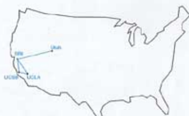
158. SCHEMA DER ERSTEN VERBINDUNGEN DES ARPA-NETZES, 1969.

Gerade die Feststellung von Koinzidenzen erklärt in dieser Hinsicht jedoch relativ wenig – die Geschichte bringt bisweilen Regelmässigkeiten hervor, für die sie uns keine Erklärungen anzubieten vermag. Technischer Wandel, dies scheint mittlerweile klar geworden zu sein, ist das Ergebnis langfristiger Forschungs- und Entwicklungsarbeit. Sie findet deshalb nicht als Ereignis in einem bestimmten Moment statt. Die Koevolution von Gesellschaft und Technik kann nicht mit einem Modell erklärt werden, das der Gesellschaft in Krisenzeiten die fundamentalen Lernprozesse und der Technik die genialen Lösungsvorschläge im günstigen Augenblick zuweist, um dann über die Beobachtung einer zufälligen Koinzidenz einen kausalen Zusammenhang zu suggerieren. Klar ist nur, dass sich der Erfolg technischer Systeme, welche von Ingenieuren geplant und entwickelt worden sind, nicht unabhängig von gesamtgesellschaftlichen Entwicklungen einstellt und dass es umgekehrt nahe liegt, ein Gutteil gesellschaftlicher Umstrukturierungen auf technisch innovative Offerten zurückzuführen.