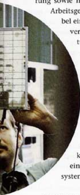
105. KONTROLLE DER HARDWARE.

Arbeitsgemeinschaft. Die in den 1960er Jahren noch als flexibel eingeschätzte Organisationsform, in der Mitarbeiter aus verschiedenen Firmen in das IFS-Projekt unter Beibehaltung ihrer ursprünglichen Anstellung delegiert wurden, wirkte sich belastend aus. Sie wurde gegen Ende des Projekts – nachdem man in der Zwischenzeit die Probleme des Projektmanagements mit systemtheoretischen Überlegungen zu lösen versucht hatte 32 – wieder schrittweise «zu einer straffen Linienorganisation» ausgebaut. Die nach dem Abbruch erfolgten Evaluations- und Implementationsarbeiten eingekaufter Systeme wurden dann jedoch in einer flexiblen Matrix-Organisation durchgeführt. 33 Auch auf dieser Ebene zeigte das IFS in aller Deutlichkeit, dass die hergebrachten Organisationsformen eines an nationalen Grenzen orientierten Innovationssystems nicht mehr zeitgemäss waren. Organisationsprobleme, so kann man in der Retrospektive beobachten, haben ganz wesentlich zum Misserfolg des IFS-Projektes beigetragen.