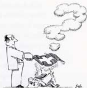
163. BRUCHZEICHEN ZUM SCHEITERN DES IFS.

Während eine Werbebroschüre der PTT noch 1979 in den höchsten Tönen von einem «evolutionary telecommunication system for the coming decades» gesprochen hatte, wurde das IFS nach seinem Abbruch im Mai 1983 in einer öffentlichen Debatte recht eigentlich zerzaust. Die «Neue Zürcher Zeitung» nannte es schlicht «ein misslungenes Grossprojekt [...] einer introvertierten Schicksalsgemeinschaft», 17 die Karikaturen der «Technischen Rundschau» waren nicht weniger direkt.