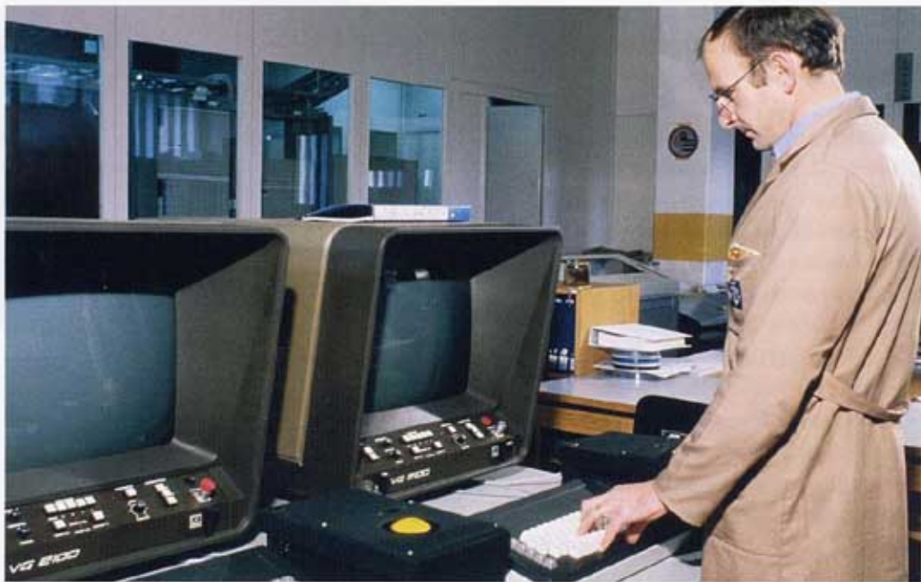
162. TESTARBEITEN AM PROTOTYP EINES BEDIENUNGSPLATZES IM IFS-KREISBETRIEBSZENTRUM.

Spätestens hier begann sich der nachträglich als «Leidensweg des IFS» bezeichnete Entwicklungspfad an unzähligen Orten und oft auch auf völlig unerwartete Weise zu verästelnd. Die Lage wurde immer unübersichtlicher und kostspieliger, der Komplexitätsgrad des Vorhabens stieg mit jeder neuen Projektphase, immer öfter musste festgestellt werden, dass früher getroffene Annahmen betreffend den Komplexitätsgrad