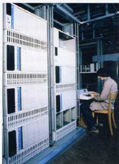
164. TESTARBEITEN AM STEUERPROZESSOR T 203

Ein zweites Hauptproblem stellte die Allokation von Rechenkapazität dar. Wie zentral musste diese sein und wie verteilt durfte sie geplant werden? Während man in der Anfangsphase des Projekts von einer «weitgehenden Zentralisierung der Intelligenz des Systems» 26 sprach und dieses Konzept bis zum Schluss nicht aufgab, beklagte sich schon 1972 einer der führenden Systementwickler bitter darüber, dass die Arbeitsgruppe 6, die sich mit dem Einsatz von Rechnern beschäftigte, schlicht «am System vorbei programmiert [habe], weil sie sich nicht hinreichend über die Funktionsweise [des] IFS-1 und die Absichten der