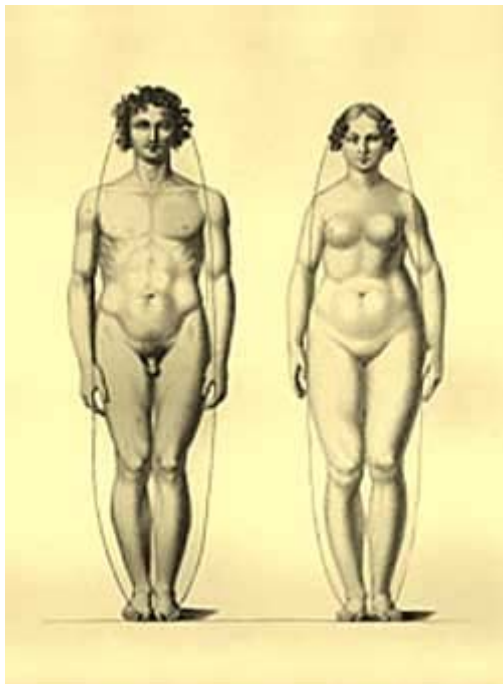
Der Mann, die Frau: grosse Ähnlichkeit, kleiner Unterschied. (Paris ca. 1822)

Edwards und Steptoe spürten die Kluft zwischen Labor und Gesellschaft. Deshalb taten sie alles in ihren Kräften Stehende, um das öffentliche Interesse auf die Geburt zu lenken. Sie ahnten, dass nicht die Seriosität ihrer Forschung, sondern das kleine Mädchen für die